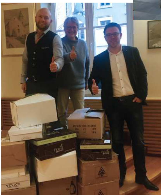
◀ Och op der Gemeen Wormer konnt en seng Adventskëscht ofginn. De Schäfferot seet jidderengem Merci de bei dëser Aktioun mat gemacht huet. Am ganze ware 26 Këschte gesammelt ginn déi un Epicerie Sociale zu Maacher gespent gi sinn.