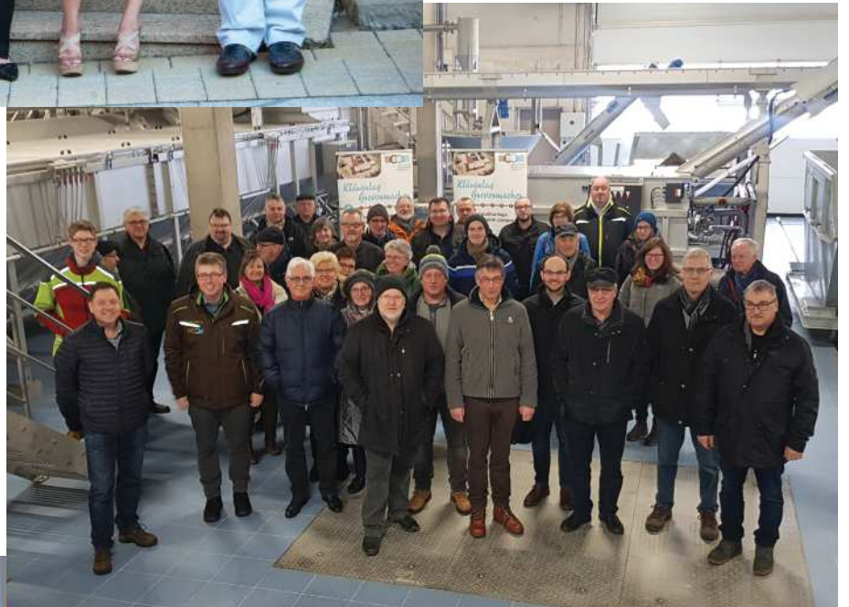
D'Ëmwelt Kommissioun an d' Klimateam vun der Gemeen Wormer haten op Visite vun der nauer Kläranlag zu Maacher invitéiert. ▶