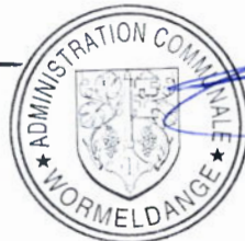
Claude Pundel Bourgmestre

Pour le collège des bourgmestre et échevins,